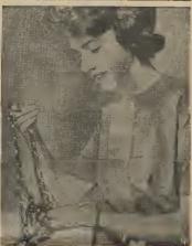
E precioso posman cu e bista riche, mi por a pensa cu mi tabata cu mi tanto amargura